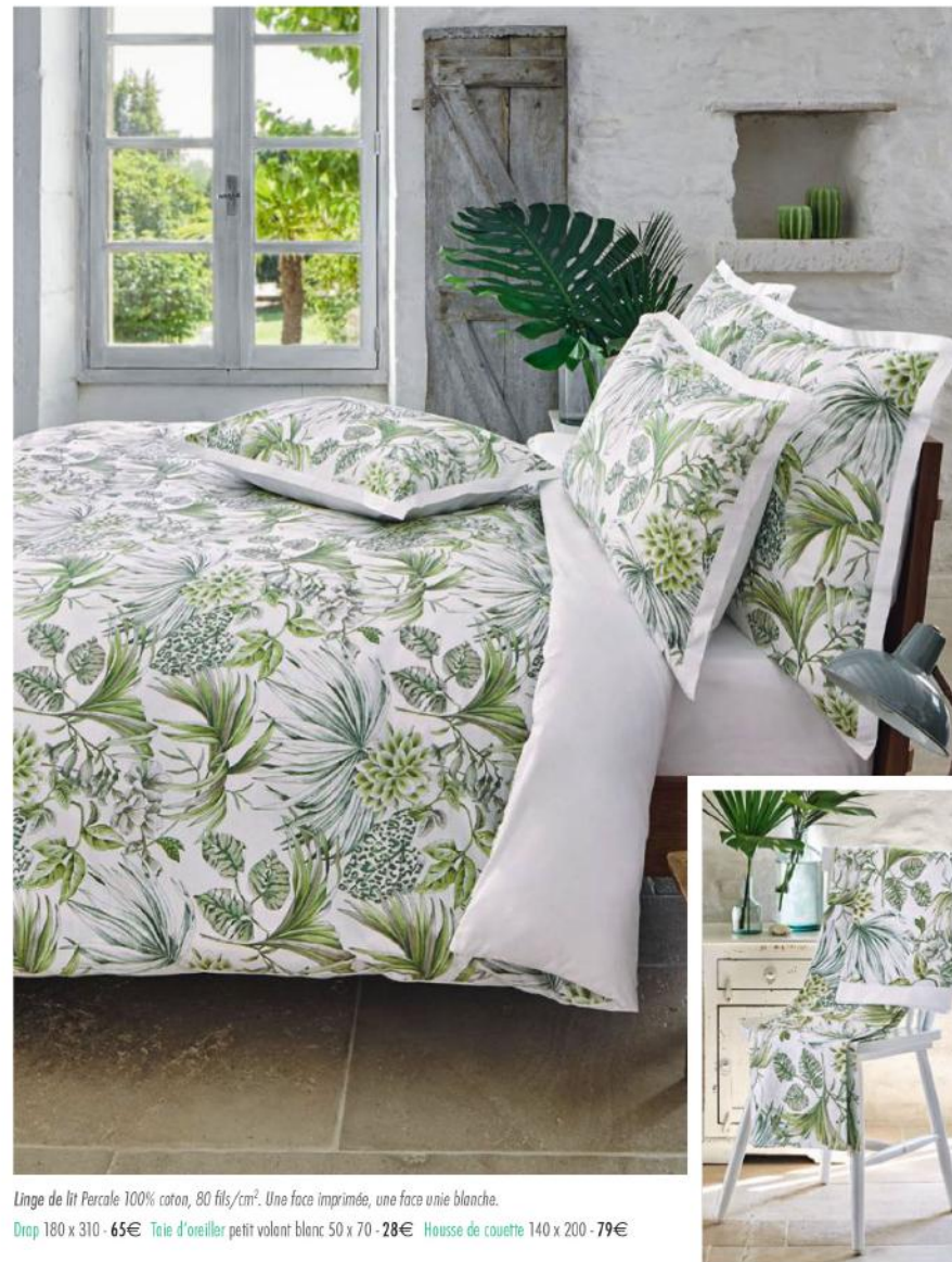
Linge de lit Percale 100% coton, 80 fils/cm 2 . Une face imprimée, une face unie blanche. Drap 180 x 310 - 65€ Taie d'oreiller petit volant blanc 50 x 70 - 28€ Housse de couette 140 x 200 - 79€

Découvrez toutes les splendeurs de la Baie d'Along, entre esprit aventurier et beauté sauvage... le naturel vous va si bien !